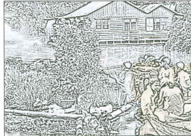
Enquête sur un jardin flottant de Prek Toal avec les enfants des classes d'éducation à l'environnement.